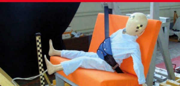
Результаты тестов использования небезопасных удерживающих устройств*

Дополнение определения «направляющая ляжка» в Правилах ЕЭК ООН № 44-04 было одобрено Всемирным Форумом (WP.29). Внесенная поправка к формулировке указывает на то, что «направляющая ляжка» рассматривается как составной элемент детской удерживающей системы и НЕ может отдельно официально утверждаться в качестве детской удерживающей системы в соответствии с настоящими Правилами». Это исключает даже формальную возможность сертификации устройств типа «направляющая ляжка»!