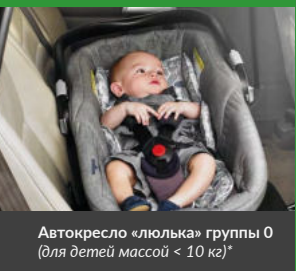
Автокресло «люлька» группы 0 (для детей массой < 10 кг)*

При покупке детского удерживающего устройства обязательно следует уточнить у продавца наличие сертификата на товар!