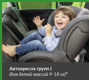
Автокресла групп I (для детей массой 9-18 кг)*