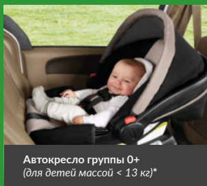
Автокресло группы 0+ (для детей массой < 13 кг)*