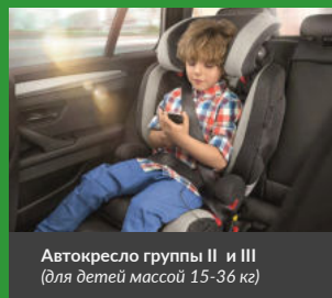
Автокресло группы II и III (для детей массой 15-36 кг)